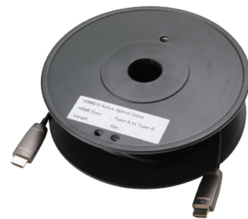
製品写真 (リール巻)